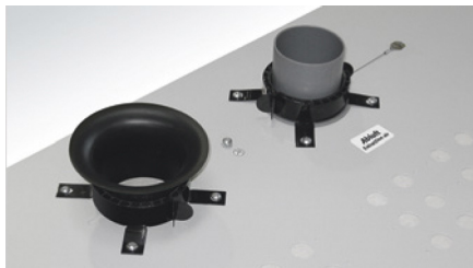
Ventilationsöppningar: Ø 75 mm.