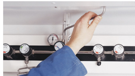
Gott om utrymme i överdelen för montering av utrustning