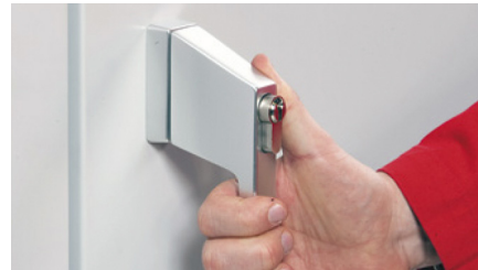
Dörrhandtag med integrerat cylinderlås