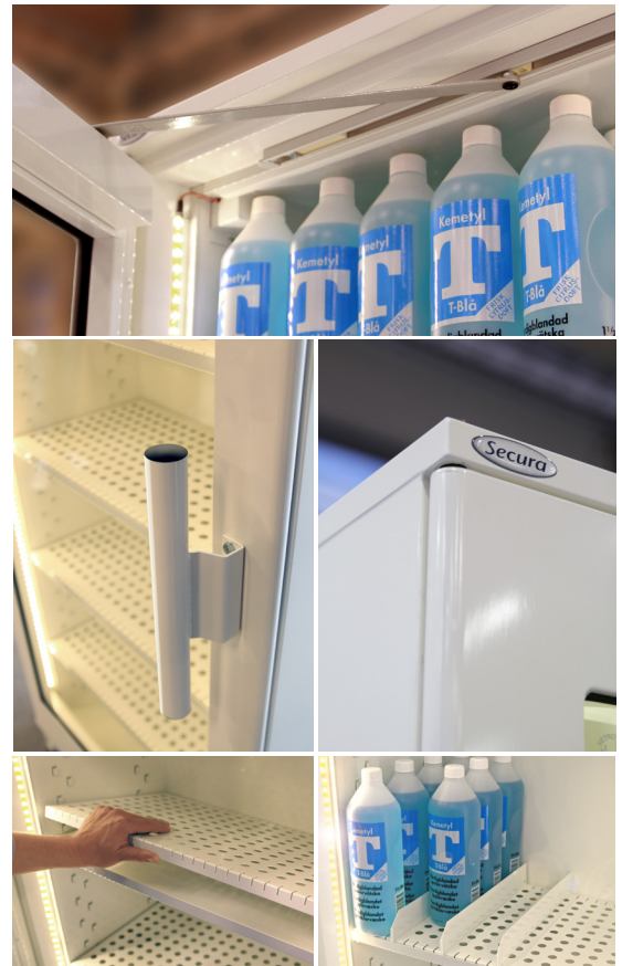
Bilderna visar ett skåp med tillvalen belysning, perforerade tråghyllor samt avdelare.

Skåpen är testade och godkända i Klass 1 enligt SP 2369 och P-märkta av SP.