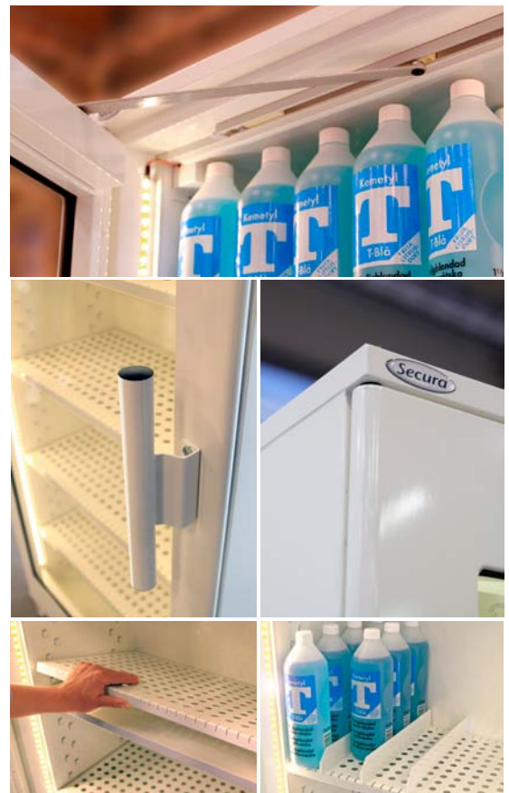
Bilderna visar ett skåp med tillvalen belysning, perforerade träghyllor samt avdelare.

Skåpen är testade och godkända i Klass 1 enligt SP 2369 och P-märkta av SP.